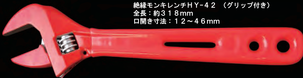
絶縁モンキレンチHY-42 (グリップ付き) 全長：約318mm 口開き寸法：12~46mm